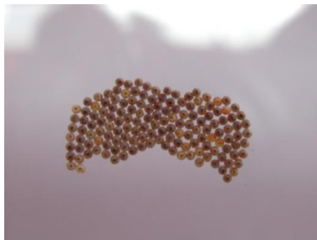
Huismoedereitjes 6 dagen