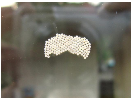
Huismoedereitjes 1 dag

Mijn vraag: waarom koos deze huismoeder het keukenraam? Voor meer informatie over de KNNV Zaanstreek-Waterland zie hun website: http://www5.knnv.nl/zaanstreek .